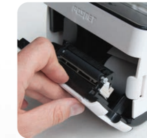
Mechanizm drukujący odporny na zachlapanie