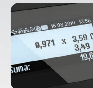
Graficzne wyświetlacze obsługi i klienta