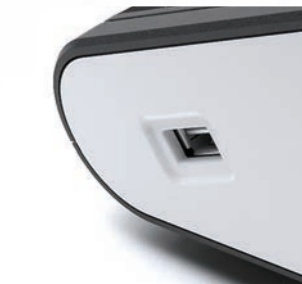
Archiwizacja danych na pendrive