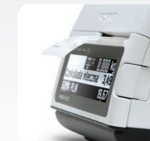
Mechanizm drukujący z obcinaczem