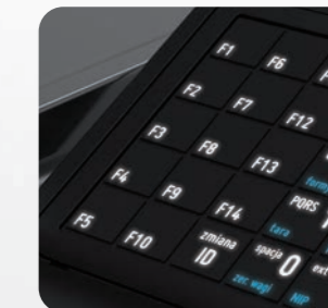
Podświetlana, bryzgoszczelna klawiatura